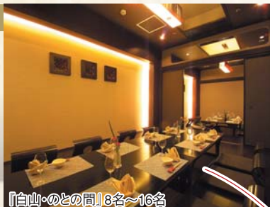
『白山・のとの間』8名〜16名