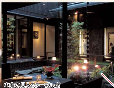
中庭の見えるテーブル席